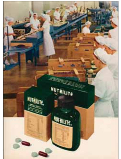
A NUTRILITE csomagolószóra

* A 2008. évi értékesítési adatok alapján, az Euromonitor International felmérése szerint.